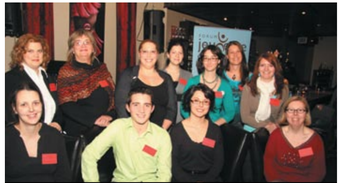
CONFÉRENCE FRIJ 2010