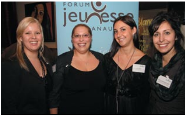
LA PERMANENCE ET LA PRÉSIDENTE DU FJL, CONFÉRENCE DE PRESSE FRIJ 2010.