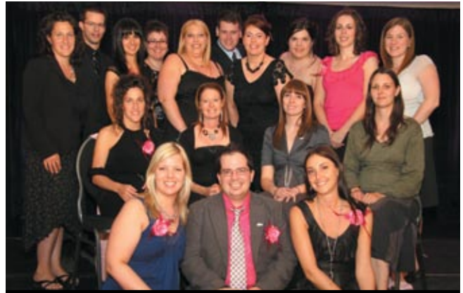
MEMBRE ET PERMANENCE FJL